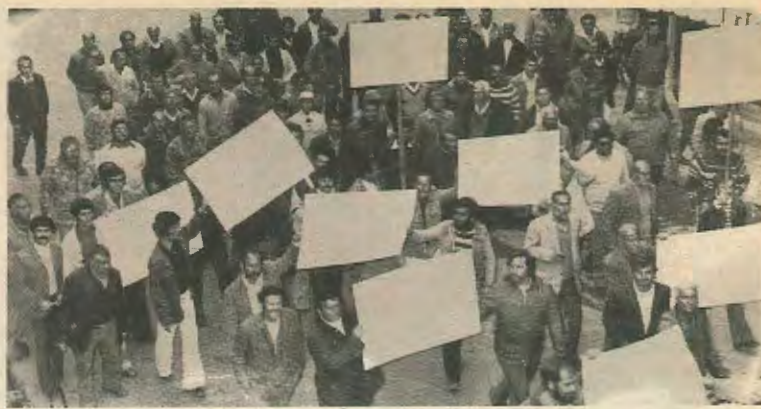
ΛΙΜΕΝΕΡΓΑΤΕΣ ΠΛΗΡΟΦΟΡΟΥΝ ΤΗΝ ΕΚΦΡΑΣΗ: